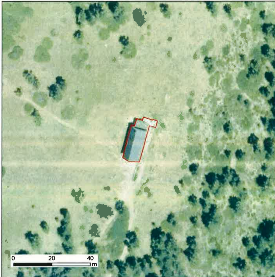
FOTO AEREA Y DELIMITACIÓN DE LA EDIFICACIÓN